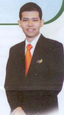
โดย คุณอนิษฐ์ สมิตะพินทุ Adv.Cert. PSCM (ITC)